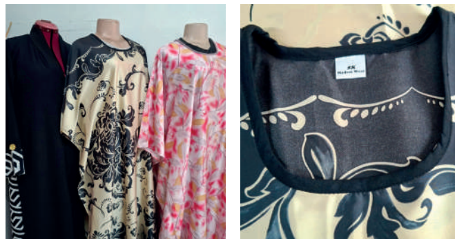
▲ Johannesburg, Südafrika: Einige Beispiele ihrer selbstgenähten Kleider unter der Modemarke „SK Modest Wear“.

Ihre Bemühungen und ihr Erfolg blieben nicht unbemerkt. Lokale Schulen – darunter die Benoni Muslim School – beauftragten sie damit, islamkonforme Schuluniformen für ihre Schülerinnen anzufertigen. Darüber hinaus erhält sie inzwischen auch individuelle Aufträge für Braut- und Festkleidung.