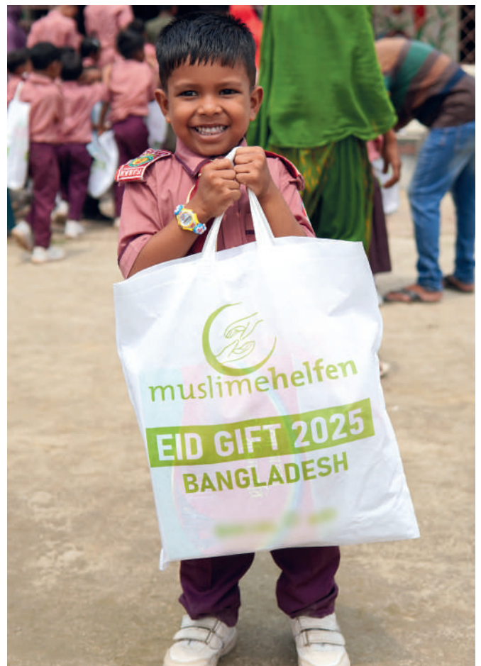
▲ Bangladesch: Große Freude beim Erhalt des Festgeschenkes.

Mit nur 25 € kannst Du dazu beitragen, dass auch dieses Fest wieder Herzen durch ein Festgeschenk erstrahlen.