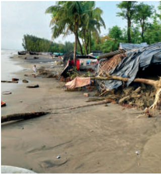
▲ Bangladesch: Verwüstung der Küstenregion Kutubdia in Bangladesch nach Sturmflut.