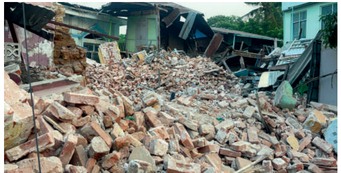
▲ Myanmar: Zerstörung durch Erdbeben in Myanmar.

Assalamu alaikum. Wir haben ein schweres Erdbeben der Stärke 7,7 in Sagaing erlebt. Dabei habe ich fünf Familienmitglieder verloren – meine ältere Schwester, meinen jüngeren Bruder, meinen Neffen sowie meine beiden 6-jährigen Enkelkinder. Sie verstarben während des letzten Freitagsgebets im Ramadan. Nach dem Erdbeben erhielten wir etwas Hilfe, doch wir standen vor großen Schwierigkeiten und mussten einen Monat lang auf der Straße schlafen. [...]