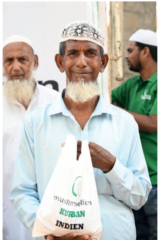
▲ Indien: Begünstigte beim Erhalt des Kurban-Fleisches.

Einen besonderen Fokus legten wir auf die schwächsten Mitglieder der Gesellschaft. In Togo wurden 50 Rinder für 700 Familien geschächtet. Die Fleischverteilung konzentrierte sich gezielt auf Menschen mit starken visuellen, auditiven und körperlichen Beeinträchtigungen. An sie konnten sechs Kilogramm überreicht werden. In Malawi in der Region Salima wurden 600 Familien - darunter chronisch Kranke, ältere Menschen und Witwen - mit Rindfleisch bedacht. In den trockenen ländlichen Gebieten von Simbabwe in Muzarabani und Hambe erhielten 1.360 Familien Kurban-Fleisch. Im städtischen Raum in Südafrika profitierten zudem 740 Familien in den ärmsten Townships von Johannesburg und Sasolburg, die extrem unter hoher Arbeitslosigkeit leiden.