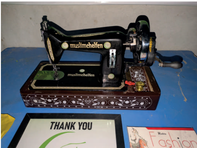
▲ Multan, Pakistan: Jede Teilnehmerin erhielt zum Abschluss des Nähkurses ihre eigene Nähmaschine.

Sie schloss den Kurs erfolgreich ab und erhielt – genau wie alle anderen Teilnehmerinnen – ein Zertifikat sowie eine eigene Nähmaschine mit Elektromotor. Während der Ausbildung bekamen die Teilnehmerinnen außerdem ein umfangreiches Nähset mit verschiedenen Schneide-, Mess- und Nähutensilien sowie Übungs- und Lernmaterialien, das sie nach Kursende behalten durften.