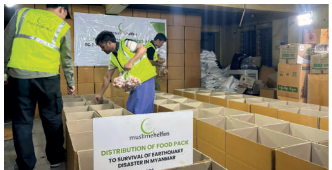
▲ Myanmar: Vorbereitung der Lebensmittelverteilung in Myanmar.