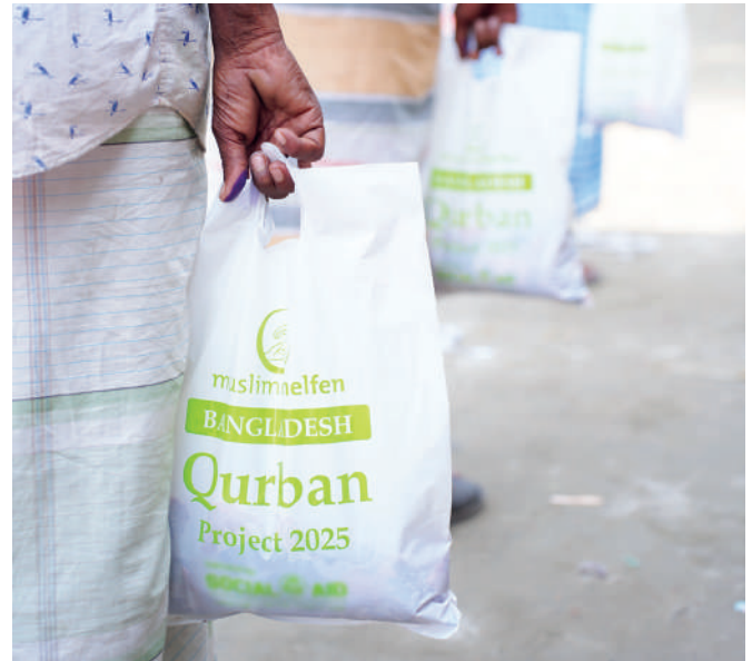
▲ Bangladesch: Tüten mit jeweils 2 kg Kurban-Fleisch für bedürftige Familien.

In Südostasien durften sich abertausende Muslime über den reichen Segen des Opferfestes freuen. In Indonesien realisierten wir mehrere großflächige Verteilungen in Aceh, Lombok und West Nusa Tenggara. Gemeinsam wurden über 3.700 Familien bedacht, und wir brachten zudem 1.757 starken Waisenkinder ein strahlendes Lächeln ins Gesicht. Lokale islamische Religionslehrer wurden in die direkten Verteilungen involviert, um sie wertzuschätzen. In Kambodscha dehnten wir das Kurban-Programm auf sage und schreibe 32 Dörfer in 11 völlig unterschiedlichen ländlichen Provinzen aus. Exakt 2.250 Familien von Reisbauern und einfachen Fischern, die mit großen finanziellen Nöten extrem schwer zu kämpfen haben, durften sich am Festtag über Rindfleisch für ihre Familien und Kinder freuen.