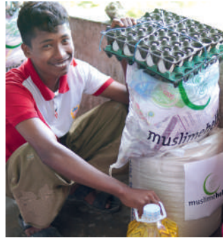
▲ Bangladesch: Verteilung von Lebensmitteln und Hygieneartikeln in Bangladesch.