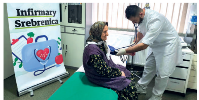
▲ Bosnien: Ältere Dame während der Behandlung durch den Krankenpfleger.

Auch Menschen aus abgelegenen Dörfern rund um Srebrenica gehören zu den Patientinnen und Patienten. Aufgrund fehlender Infrastruktur und eingeschränkter öffentlicher Verkehrsmittel ist der Zugang zu größeren Krankenhäusern in Städten wie Tuzla oder Sarajevo oft mit großen finanziellen und organisatorischen Hürden verbunden. Die Krankenstation schließt diese Lücke und bietet vielen Menschen eine dringend benötigte, nahe und verlässliche medizinische Unterstützung.